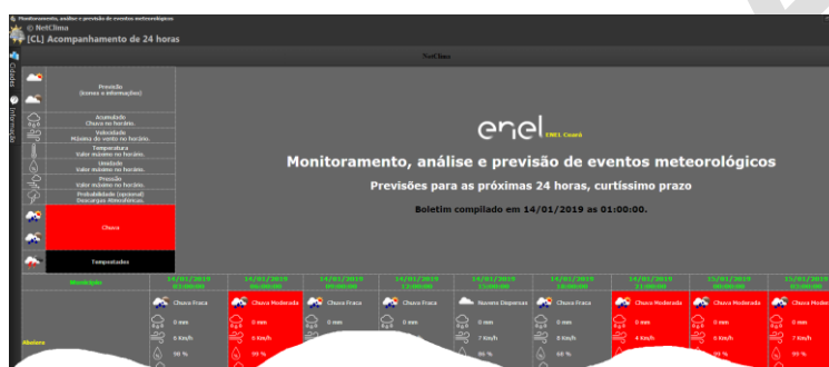
Figura 1 – Visualizador Acompanhamento 24 horas

Clique no botão para acesso ao visualizador Acompanhamento 24 Horas ( vide figura Figura 1 – Visualizador Acompanhamento 24 horas).